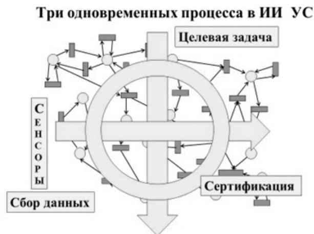
Рис. 2. Активационные процессы в языковой единой радикальной модели мира УС: целевой, сенсорный и сертификационный

2) При проведении текущего сенсорного процесса в УС и в театре ее действий должны во время вноситься и учитываться ситуационные изменения в единую модель УС.