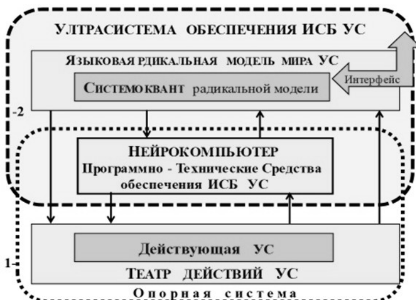
Рис. 3. Ультрасистема обеспечения ИСБ УС

4.1. Информационно-системная безопасность (ИСБ) УС. Требование ИСБ УС реализует целевую установку лидера данной УС. Понятие ИСБ УС является глобальным двуединым требованием, которое имеет тесно связанные между собой две стороны безопасности, информационную и системную . ИСБ УС включает в себя все частные случаи безопасности УС от экологической, энергетической и т.д. до функциональной безопасности, рис. 3.